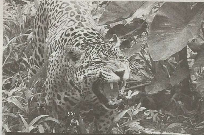
Jaguares del centro de conservación Rancho Fátima, de Morona Santiago, serán trasladados al bioparque Amaru.