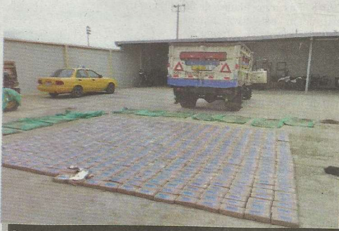
Paquetes de droga que fueron incautados por la Policía Antinarcóticos durante el operativo "Palmar".