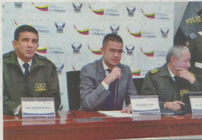
Andrés de la Vega (c), viceministro de Seguridad Interna, convoca a los jóvenes a formar parte de la Policía Nacional.

Los interesados en formar parte de la institución policial deben cumplir con los siguientes requisitos: ser ecuatoriano de nacimiento, no ser menor de 17 años ni mayor de 24 años y 11 meses a la fecha del llamado.